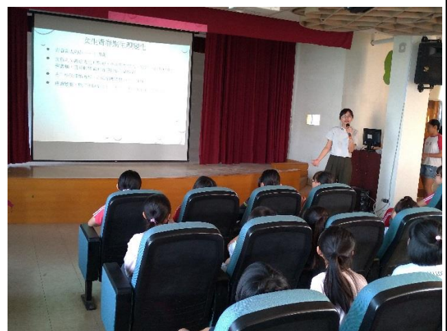
外聘衛生所護理師宣導性教育(含愛滋病防治)的重要性